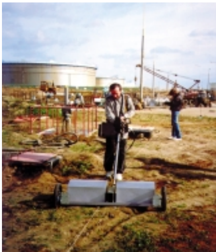
Рис. 4. Исследование коммуникаций на нефтеперерабатывающем предприятии

Заложены многочисленные алгоритмы, повышающие удобство управления прибором, а также позволяющие проводить различные обработки принимаемых сигналов. Автоматическое определение диэлектрической проницаемости приповерхностного слоя земли дает возможность разметки шкалы глубин. Выбор закона изменения усиления и его параметров позволяет компенсиро-