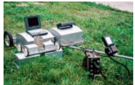
Рис. 6. Полный комплект георадара

Геолокатор может быть использован для исследования приповерхностных слоев земли в строительстве, коммунальном хозяйстве, для обнаружения пластмассовых мин (что невозможно с помощью обычных миноискателей), при строительстве и эксплуатации железных дорог, обнаружении и определении размеров залежей полезных ископаемых, исследовании толщины и состояния ледяных покровов, поиске грунтовых вод и т. п. Работа с геолокатором представлена на рис. 3 - 6. ●