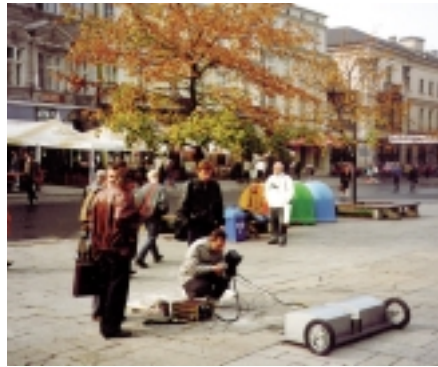
Рис. 5. Исследование городских коммуникаций

Для построения изображения подповерхностного профиля используются режимы поиска объектов и сканирования. При этом передающая и приемная антенны перемещаются вдоль обозначаемых на поверхности профилей и происходит непрерывная регистрация отраженных сигналов. Для разметки горизонтальной шкалы на профиле проставляются точки с известными взаимными расстояниями, и при перемещении антенн вдоль профиля эти точки отмечаются на рисунке вертикальной линией. На основе собранных сигналов получается временной профиль, на котором ось глубин калибрована в единицах времени. Различные значения коэффициента отражения соответствуют различным значениям градаций яркости на индикаторе или