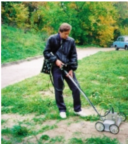
Рис. 3. Работа с георадаром на малых глубинах

тур сигналы регистрируются затем приемной антенной.