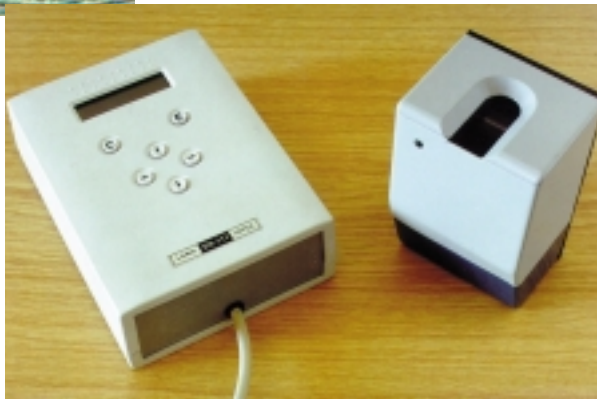
Рис. 1. Общий вид DS-111 вместе со сканером

фирмы Octagon Systems. Выбор данного вычислительного модуля объясняется тем, что при минимальных размерах и энергопотреблении он имеет на одной плате все необходимые аппаратные