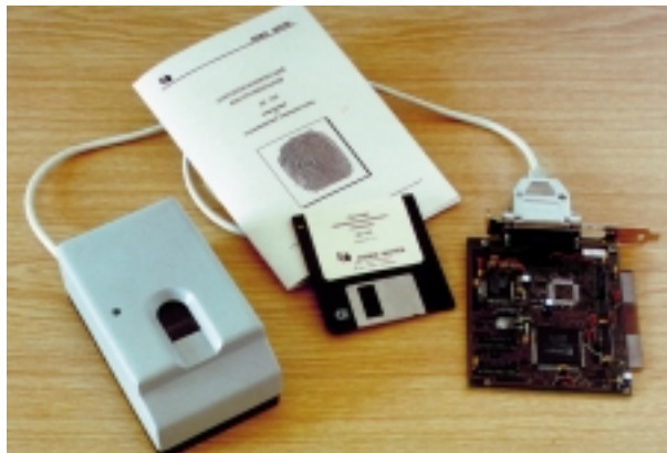
Рис. 2. Плата ввода телевизионного сигнала

На плате сопряжения, расположенной непосредственно у передней стенки контроллера, находятся жидкокристал-