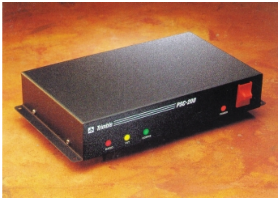
Рис. 2. Контроллер PCS-200

ется преимуществами дифференциального режима GPS [1], то NC Manager производит передачу через коммуникационные станции на транспортные средства дифференциальных поправок (при использовании обычного дифференциального режима) или коррекцию координатной информации, поступающей с транспортного средства (так называемый инверсный дифференциальный режим). Конечно, при этом необ-