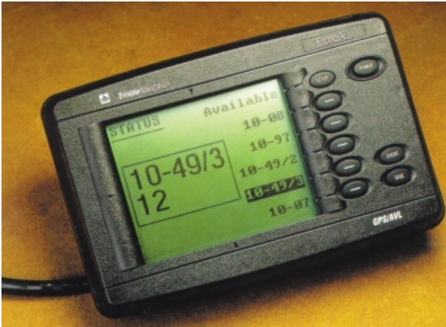
Рис. 3. Терминал EchoXL

ходимо наличие в диспетчерском центре эталонного GPS-приемника типа 4000RS. Как завершающий элемент простой следящей системы Trimble Navigation предлагает программу AVL Manager, работающую на отдельном персональном компьютере (386-м или 486-м). Она позволяет диспетчерам и руководителям управлять функциями слежения. Поступающие в диспетчерский центр данные отображаются в текстовой форме на дисплее компьютера, а если на него установлена специальная коммуникационная плата, то возможностями системы можно пользоваться с нескольких дополнительных терминалов (типа Wise 370). Терминалы подключаются к плате DigiBoard, имеющей 8 асинхронных последовательных портов. Программа управляет несколькими базами данных: по транспортным средствам, по улицам города и перекресткам. Предусмотрено 3 уровня доступа к данным: для системного администратора, руководителя службы и диспетчеров. AVL Manager поддерживает стандартный хорошо документированный протокол CAD (эта аббревиатура в данном контексте означает Computer Aided Dispatch). С его помощью данные об объектах диспетчеризации передаются внешним устройствам. Благодаря существованию этого протокола система становится открытой: любая компания может создавать дополнительные комплексы обработки данных и независимо поставлять их конечным пользователям.